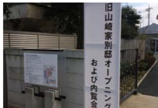
旧山崎家別邸オープニング式典