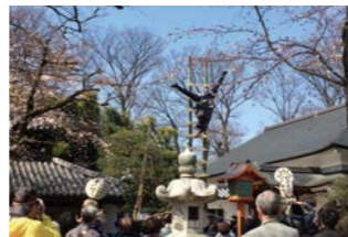
小江戸川越春まつり