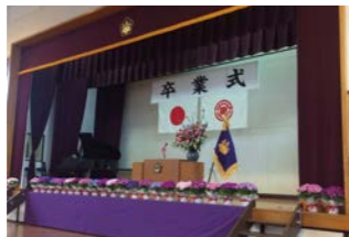
川越市立中央小学校 卒業式