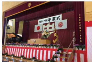
川越市立川越第一中学校 卒業式